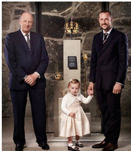
Den norske arverekken 2006.