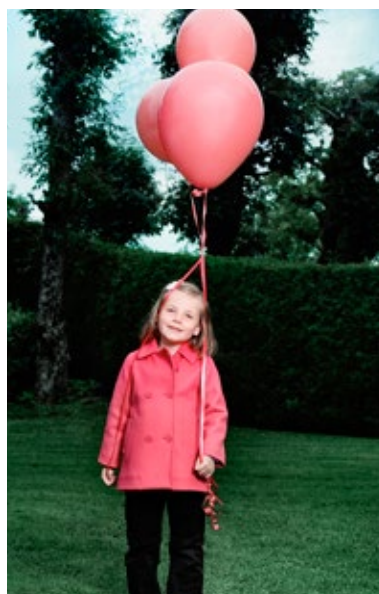
Prinsesse Ingrid Alexandra på Skaugum, november 2008.