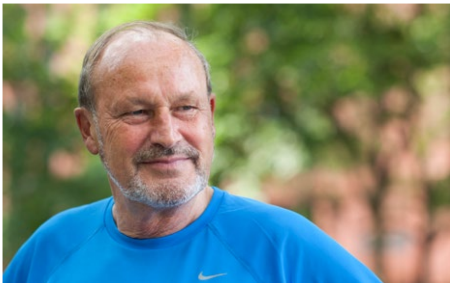
tydelig og ofte provoserende: Per Fugelli holder åpningsforedraget på Kulturskoledagene 2013.

Både i forskning og undervisning er Fugelli opptatt av hvordan fordeling av makt og goder i samfunnet påvirker