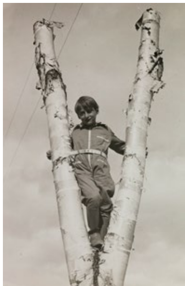
Prins Harald i Little Norway, Canada under krigen.