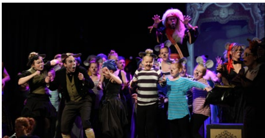
sammen om opera: Kulturskolene i Hå og Klepp gjør suksess med operasamarbeid.