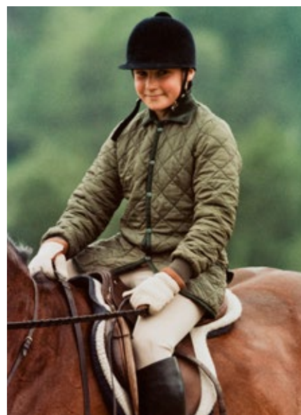
Prins Haakon Magnus på hesteryggen.

– Bilder er makt. De er overalt, hele tiden og mer og mer. Slik sett kan det være fint for de unge å få noen knagger som kan hjelpe dem med å analysere den store bildeflommen som de utsettes for», sier Hernes.