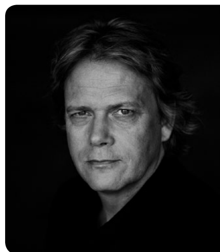
årets juryleder: Rolf Løvland skal lede arbeidet med å finne årets hundre mottakere av Drømmestipendet.

Løvland vokste opp i Kristiansand og startet sin musikalske karriere i gospelmusikkmiljøet. Hans første sanger kom på plate i 1976. Samtidig tok han en utdanning i musikk, først ved Musikkonservatoriet i Kristiansand og senere ved Institutt for musikkvitenskap ved Universitetet i Oslo. Hans komposisjoner fins på plater som har solgt i millionopplag verden over.