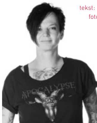
tekst: hege arstad

– Kulturskolen er en stor og tung aktør som vi i AKKS ser veldig opp til. Problemet til kulturskolen, spesielt i de store byene, er at de lange ventelistene gjør at barn og unge risikerer å vente i årevis før de får et tilbud. Jeg tror at et samarbeid mellom AKKS og kulturskolen er gullverdt for alle parter, sier Hammer.