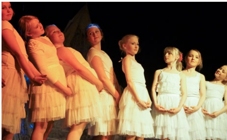
nominert i nord: Just D@nce fra Vadsø er nominert til Drømmestipendet 2013.