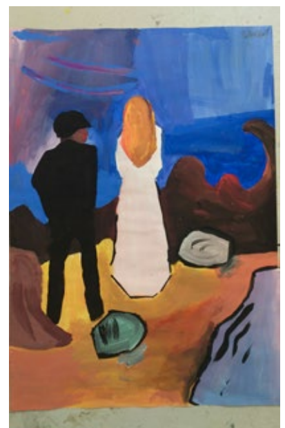
«de ensomme»: malt av Boiana Nikol Tchaev.