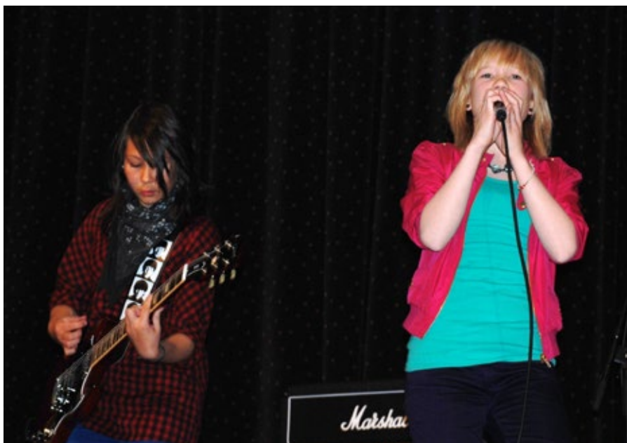
sjelden vare: The BlackSheeps var opprinnelig et band med overvekt av jenter, det er fortsatt en sjeldenhet, noe både AKKS og flere kulturskoler ønsker å endre på.