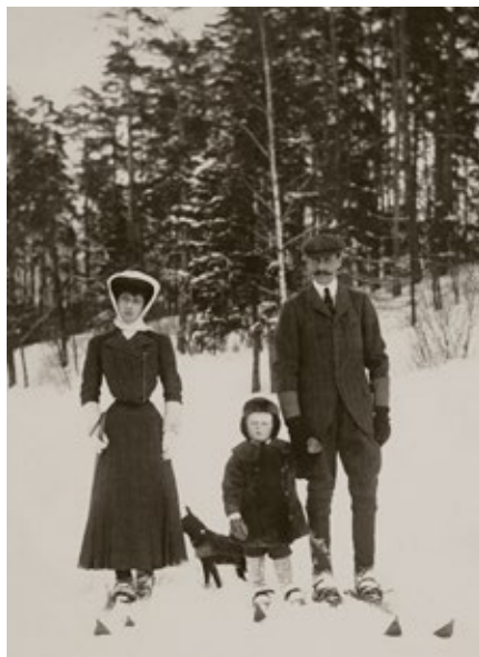
Kong Haakon, dronning Maud og kronprins Olav på ski, Bygdø Kongsgård 1907.