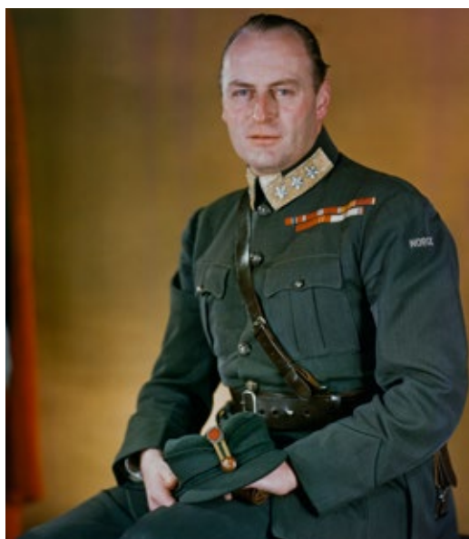
Det første kjente fargefotoet av kronprins Olav. Bildet ble tatt mens kronprinsen var i eksil i England under andre verdenskrig, 1942.